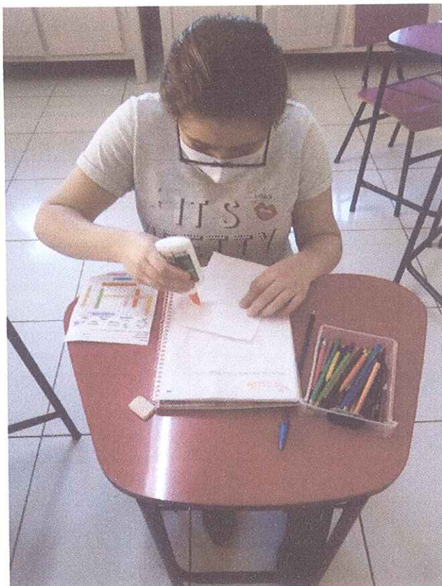
FIGURA 1 - ATENDIMENTO PEDAGÓGICO