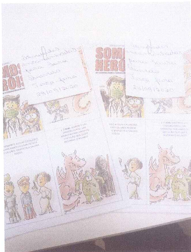
FIGURA 3 - ENTREGA DE ATIVIDADES