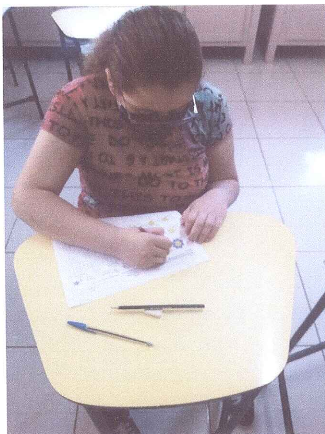
FIGURA 4 – ALUNA FAZENDO ATIVIDADES